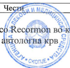
Табела 3: Несакани реакции што се припишуваат на третман со Resorpton во контролирани клинички студии кај пациенти од програма за предонација на автологна крв